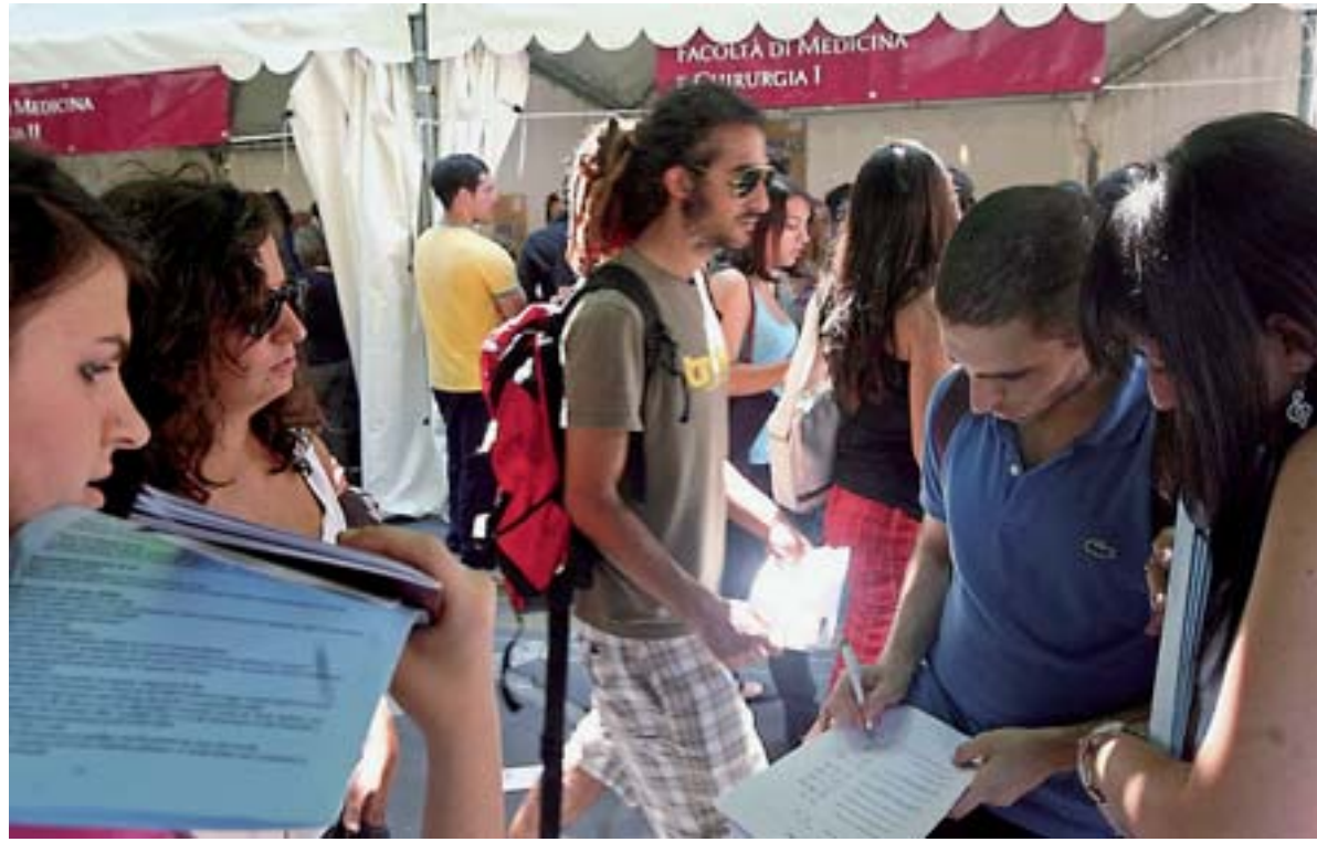
Porte aperte Primo dei tre giorni di orientamento alla Sapienza, affollate dai liceali appena usciti dalla maturità (Jpeg)

Ora, se si pensa al riaccendersi dei localismi, alle leghe che stanno nascendo anche al sud, alla divaricazione economica sempre più ampia tra il settentrione e il meridione del nostro Paese, fa un certo effetto pensare che il romanesco, o meglio la lingua romanesca delle fiction, sia rimasta una delle poche cose che ancora uniscono l'Italia.